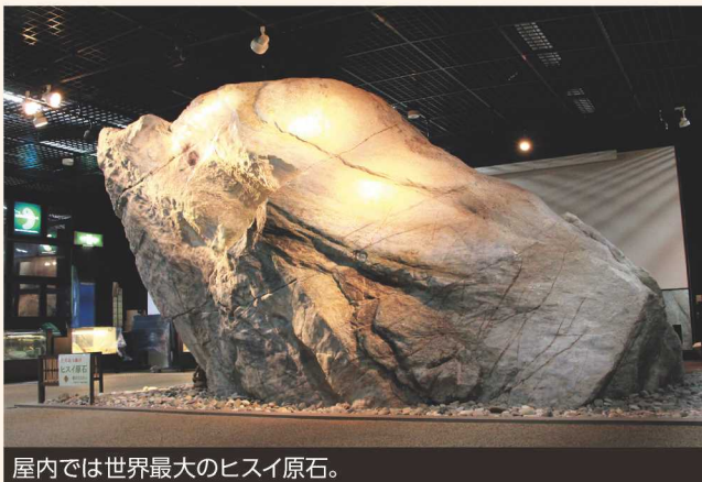
屋内では世界最大のヒスイ原石。