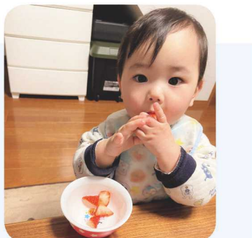
↑大好きなイチゴ、越後姫! もっとちょうだい〜。