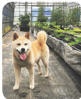
↑イチジクのハウスを見回り!