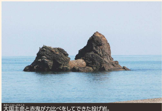
おかくにぬしのみさと 大国主命と赤鬼が力比べをしてくれた投げ岩。