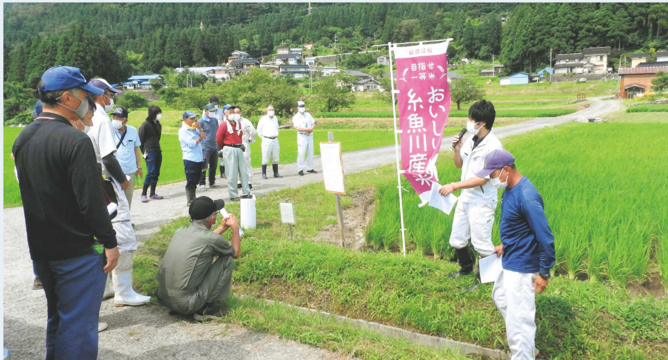
↑令和3年の新之助研究会現地研修会の様子。

新潟県産米の新しいブランド品種として開発されたうるち米晩生品種「新之助」は、本格的な生産開始から今年で6年目となります。JAひすい管内では「糸魚川産新之助研究会」を立ち上げ、品質の良い新之助の生産を目標に活動しています。