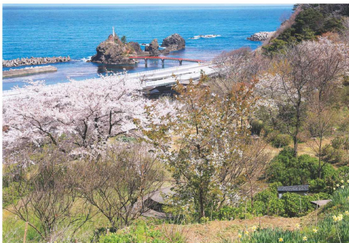
撮影場所：能生地区 能生

素晴らしい景色をカレンダーに掲載という形で発信でき、とても嬉しいです。地域の魅力を引き出し、糸魚川の活性化につなげていけたら、と考えながら撮影しています。