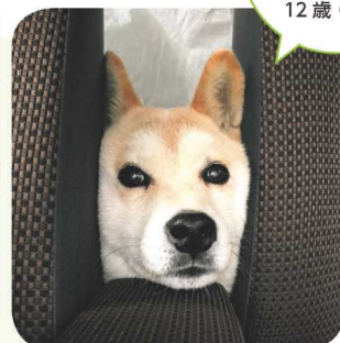
↑隙間があると、つい入りたくなっちゃう。