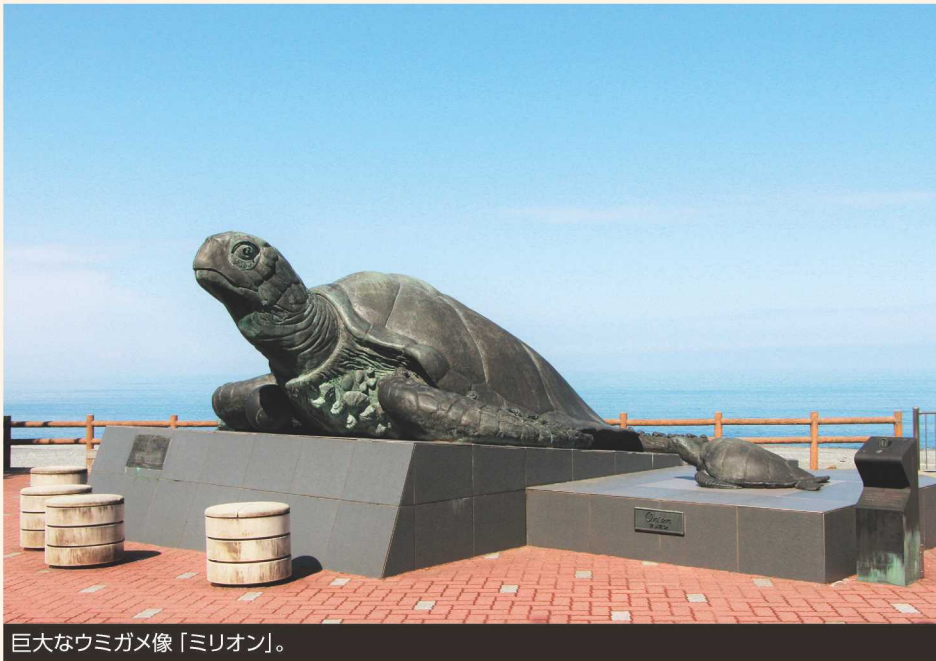
巨大なウミガメ像「ミリオン」。

あたたかい日差しが心地よい某日。本店事務所から国道8号線を西へ、道の駅・親不知ピアパークへと向かった。ピアパークは海岸の大パノラマを眺めることができる場所で、潮風を感じながら散歩するにはもってこいだ。駐車場に着くと、ウミガメ像「ミリオン」が迎えてくれた。昔は親不知にもウミガメが生息していたが、環境の変化によりその姿を見かけることは無くなったそうだ。環境保全の大切さの象徴としてピアパーク内ではウミガメのシンボルが多く見られる。糸魚川の海では様々な形の石を拾うことができるが、糸魚川―静岡構造線の西側である親不知海岸では特に種類が豊富だ。歩いていると、綺麗