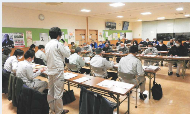
↑技術対策について情報を共有しました。