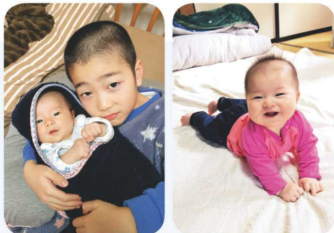
↑お兄ちゃんに抱っこしても ↑満開の笑顔♪ らうと、安心するなあ。