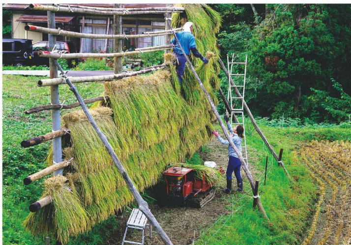
撮影場所：木浦地区 木浦

長者温泉に向かう途中、手際よく稲架掛けをされているお二人を見て、思わず撮影させていただきました。最近人手不足や機械化で、ほとんど見られなくなった光景です。手間がかかる大変な作業なので、きっとおいしいお米になるだろう、と思いながらシャッターを切りました。