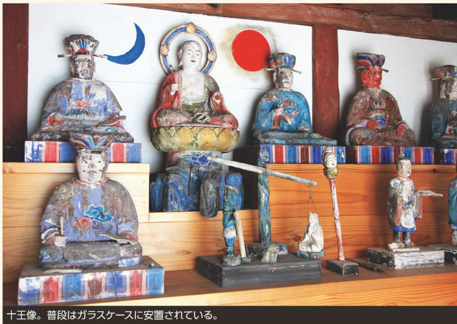
十王像。普段はガラスケースに安置されている。

蒸し暑さが続く7月下旬、大野地区での取材の帰り道に気になる建物を見つけ、近くにある姫川相談プラザに車を停めた。石碑には「十王堂」と書かれてある。