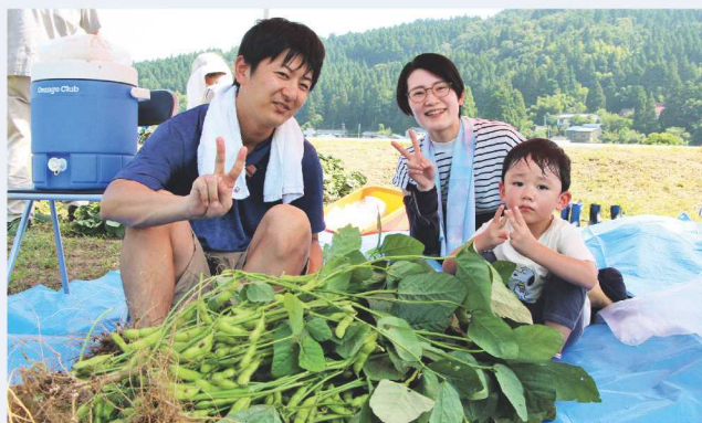
↑様々な年代の方が参加しました。