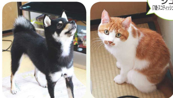
↑ママにおやつをおねだりするべく。 ↑先輩猫のジュン。テレビの後ろがお ドーナツみたいに丸い尻尾が特徴さ♪ 気に入リスポットなんだって！