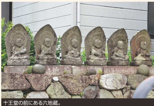
十王堂の前にある六地藏。

外に出ると、6体のお地藏様がいることに気がつく。「六地藏」は柔らかな表情をしており、十王堂の裁きの光景を見た後だったので、少しほっとした気持ちになった。閻魔様にお地藏様。子どもの頃によく聞いた昔話を彷彿とさせ、懐かしく感じた。純粋で正直な気持ちを忘れないようにしよう、と思いながら、十王堂を後にした。