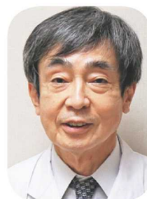
JA新潟厚生連糸魚川総合病院