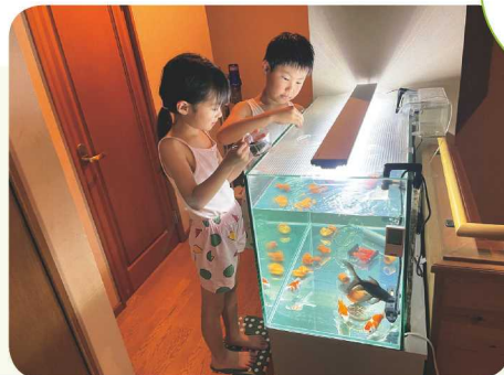
↑仲間4匹で仲良く泳ぐよ♪