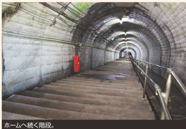
ホームへ続く階段。