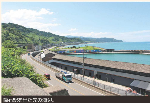
筒石駅を出た先の海辺。

になったそうだ。 改札口のある地上から地下までは高低差が40メートルある。ホームに続く約280段の階段を一步一步降りる度に、体感温度が下がっていった。 ホームに出ると、ちょうど電車が到着したところだった。電車のヘッドライトがホームの壁面を煌々と照らし、地下水だろうか、水の流れる音が絶えず響いている。地上の暑さを忘れるような涼しさに、不思議な気持ちになった。 階段を登り、改札を出ると、眩しい日差しと青々とした海が迎ええてくれる。一気に現実を引き戻されながら、独特の冷涼感を来年もまた味わいたいものだ、と思った。