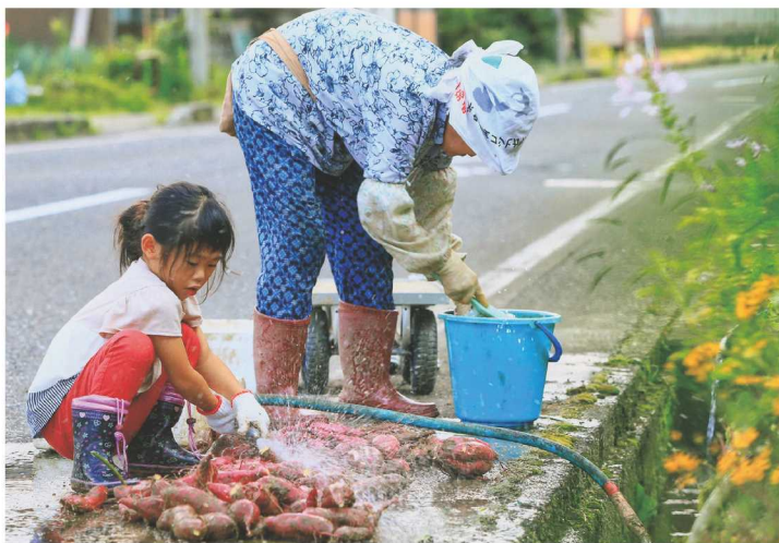
撮影場所：能生谷地区 溝尾

この一枚で、少しでも農業の楽しさや面白さが伝わり、次世代に繋げていけたら嬉しいです。