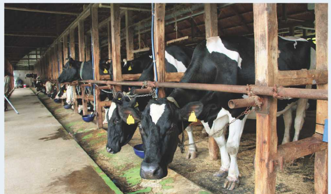
↑干し草を食べ終え、リラックスした牛たち。