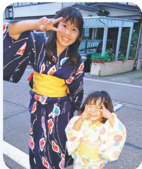
↑初めて浴衣を着たよ! ねねと一緒にピース☆