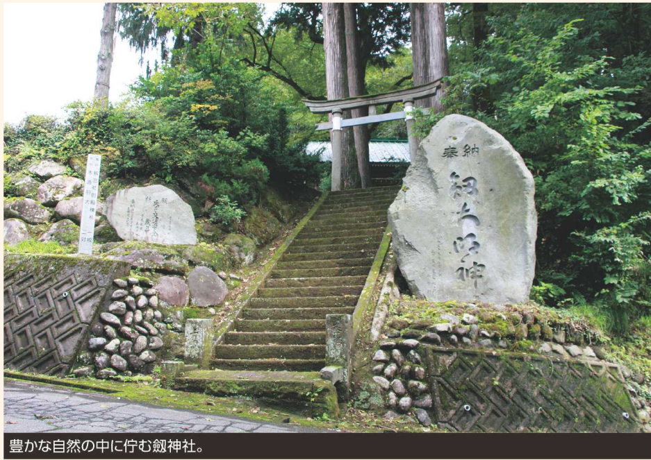
豊かな自然の中に佇む劔神社。

すっかり秋の様子を呈してきた10月上旬。上早川へ向かう県道270号線を車で走り、劔神社に着いた。 劔神社は、小高い丘に位置しており、道に面した参道には大きな石碑がある。創祀年代は不詳で、出雲国から佐多神社を勧請したとされる。創建当時は佐多神社と称し、もとは銚ヶ岳山頂に鎮座していたが、平安時代に現在の宮平に遷座した。古代の劔を御神爾(神様の印)としたことから、現在の名称になったとされる。 苔むした階段のやわらかい感触を楽しみながら、ゆっくり登っていく。境内に着くと、早川の穏やかな流れを一望することができる。拝殿の周りにはサクラ、コナラ、杉など