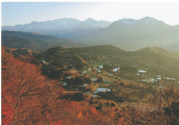
撮影場所：能生地区 高倉