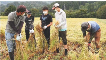
※今回はコロナ禍により、ホテル泊での対応となりました。

9月20日~22日、東京の聖学院中学校の生徒150名が3年ぶりに糸魚川市を訪れ、体験学習を行いました。今回の体験では、稲刈り体験のほか、林業・漁業・観光業体験、フォッサマグナミュージアムなどの見学などを行い、糸魚川に対する知識を深めました。