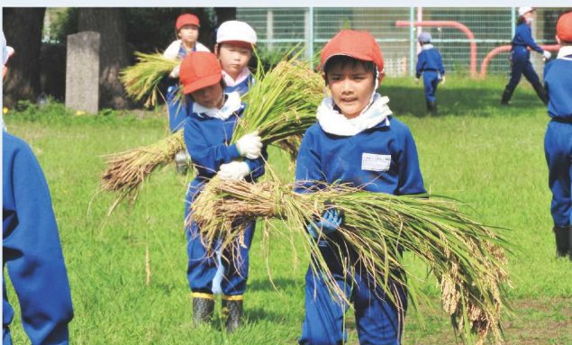
↑両手でしっかり稲を持ち、運ぶ下級生。

子どもたちに自分たちが育てた米を収穫するという喜びを感じてもらうために、JAひすいでは今後も食農教育活動を続けていきます。