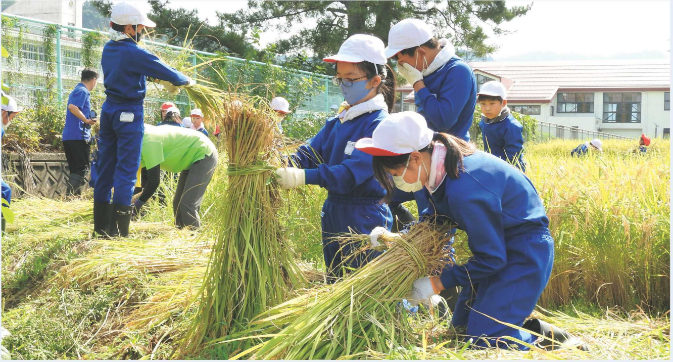
↑刈った稲を束ねる上級生。

今年も糸魚川市内の多くの小学校では、食農教育の一環として米作りに取り組みました。JAひすいの組合員、職員は学校の先生や保護者の皆さんとともに、児童の作業をサポートしました。