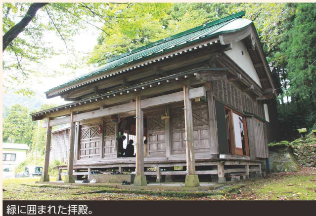
緑に囲まれた拝殿。

の木々が並び、足元は紅葉とドングリで彩られている。自然と調和した様子に心が穏やかになった。 周辺を散策していると、地区の人たちが集まってきた。年に一度の秋祭りが開催されるそうだ。今年の稲作も終わりを迎えようとしている。収穫に感謝し、秋の穏やかな空気に包まれながら神社を後にした。