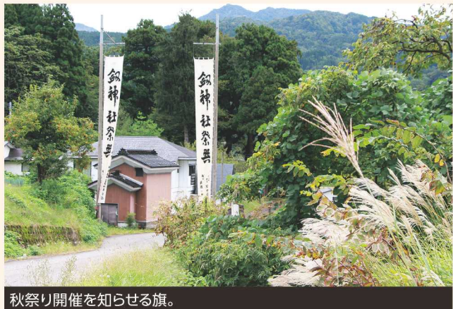
秋祭り開催を知らせる旗。