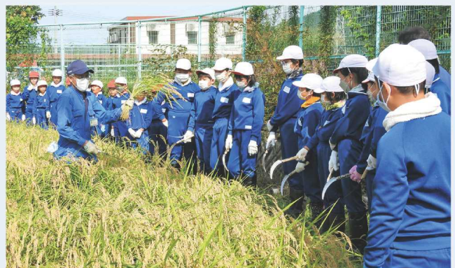
↑稲の刈り方を教える営農部職員。