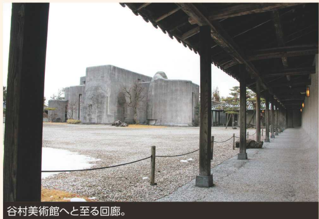
谷村美術館へと至る回廊。