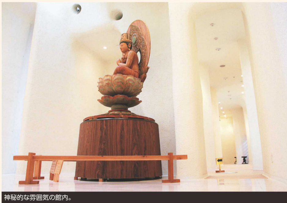
神秘的な雰囲気館内。

雪が小降りになった某日。ゆっくりと美術品を見て回ろうと思いつき、谷村美術館へと赴いた。この美術館は昭和58年に建設されたもので、全景がシルクロードの遺跡をイメージしているそうだ。建物は建築家・村野藤吾が設計し、彫刻家・澤田政廣が手がけた仏像彫刻やデッサンが展示してある。日本の建築界と彫刻界をリードした二人の魂の結晶とも言える場所だ。