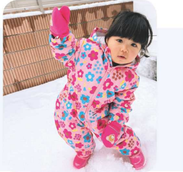
↑じい・ばばの家ではじめての雪遊びをしたよ!