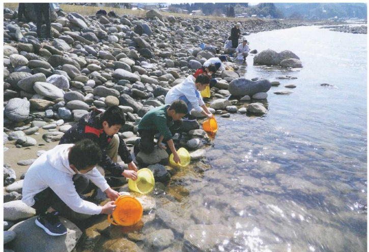
撮影場所：大野地区 大野

私たちは現在6年生で、卒業をすると離れ離れになりますが、心は繋がっています。鮭も大きくなって、海と繋がっている姫川に戻ってきてほしいです。