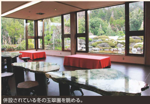
併設されている冬の玉翠園を眺める。

時間帯によって自然光は変化するため、同じ作品でも違った表情を見ることができるとうだ。 作品を見終わりに、一息つくと玉翠園へと向かう。石窟調の美術館をひとしきり歩き彫刻を見た後は、満ち足りた気持ちになっていた。今度は違う季節にも来てみよう、と窓から冬の庭園を眺めながら考えを巡らせた。