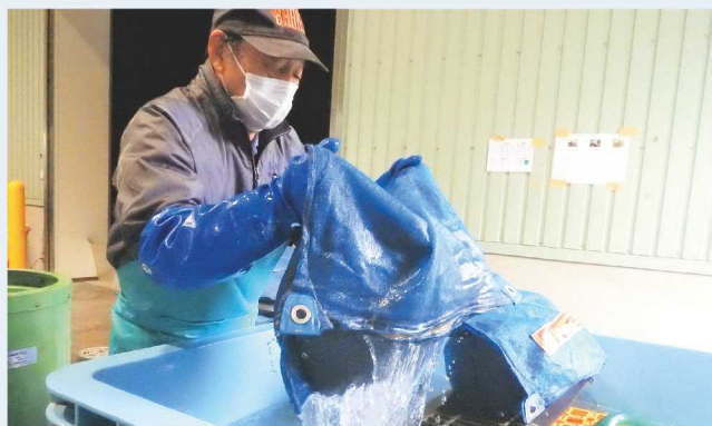
↑作業倉庫内の気温は外気温とほぼ同じです。

JAひすいは令和3年12月下旬から令和4年2月初旬までの期間、東川原の早川倉庫で種もみの温湯消毒を実施しました。 米作りにおける、いもち病やばか稲病などの種もみが伝染源となる病害虫の防除は、化学農薬による種子消毒と生育期の農薬散布を組み合わせる行うことが一般的です。しかし、使用済み農薬の処理には莫大な経費がかかり、環境問題にも関係します。 温湯消毒ではその課題を解決することが可能であり、これは網袋に入れた種もみを60度の湯に10分間浸した後、流水で冷却し乾燥させる消毒方法で、防除効果は農薬を使用した場合と同程度となります。JAひすいではエコライス栽培を行っており、化学肥料の割合50パーセント以下、農薬成分数を同市の慣行栽培基準の17成分から8成分以下にするよう取り組んでいます。種もみの温湯消毒はその一環です。