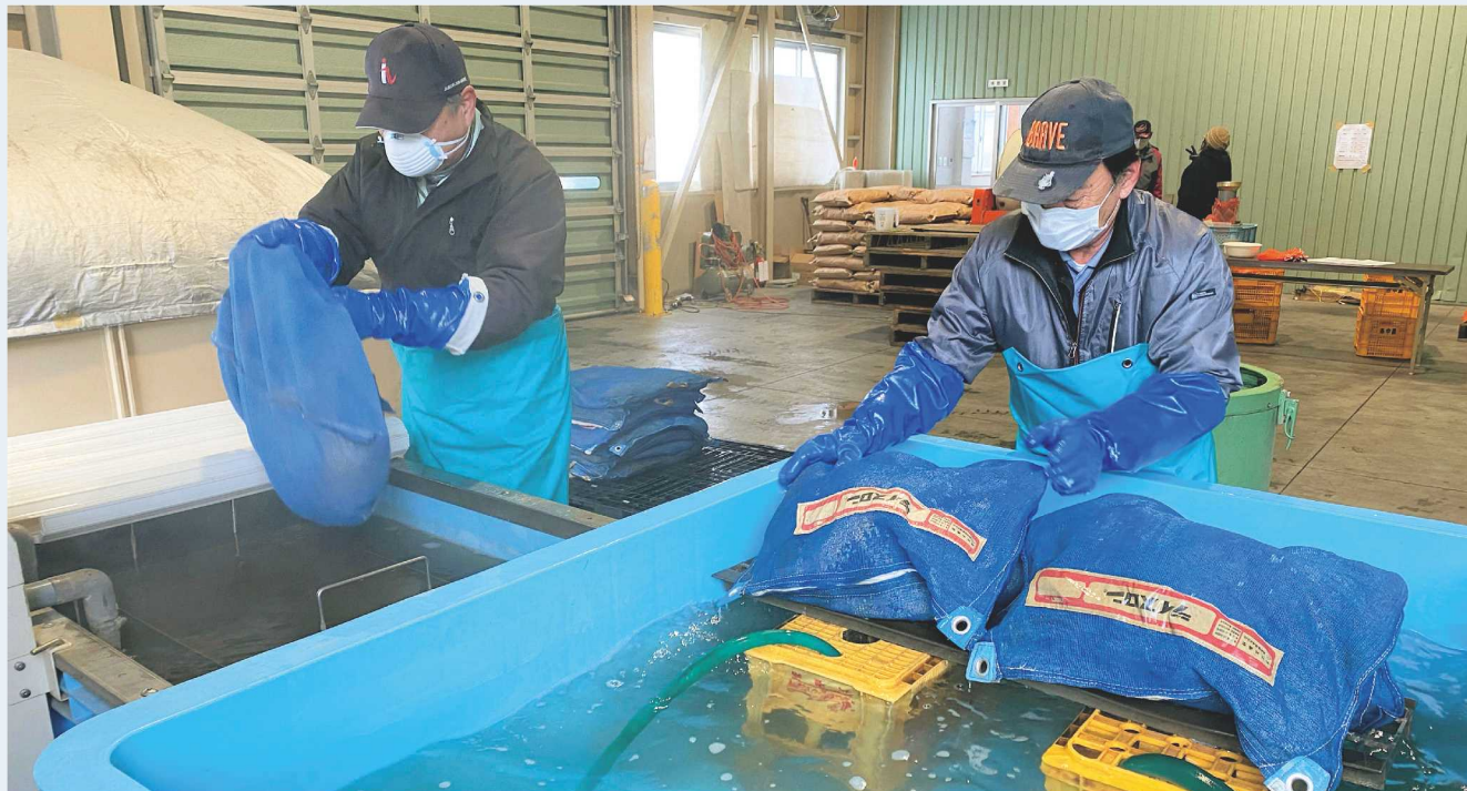
↑種もみを湯に浸して冷ます作業を繰り返します。

はこれからも安全・安心な米作りをサポートします。 約10トンで、3月9日から生産者に順次配達予定です。JAひすいはこれからの安全・安心な米作りをサポートします。