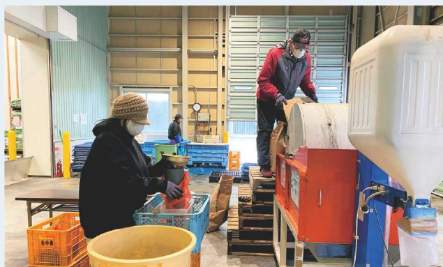
↑種もみを小分けにし、網袋に入れる作業。