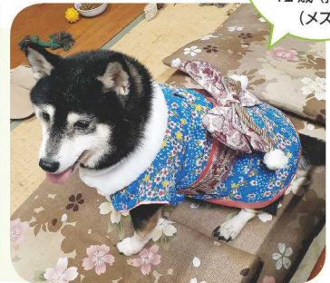
↑お正月にきれいな着物を着せてもらったわ♪